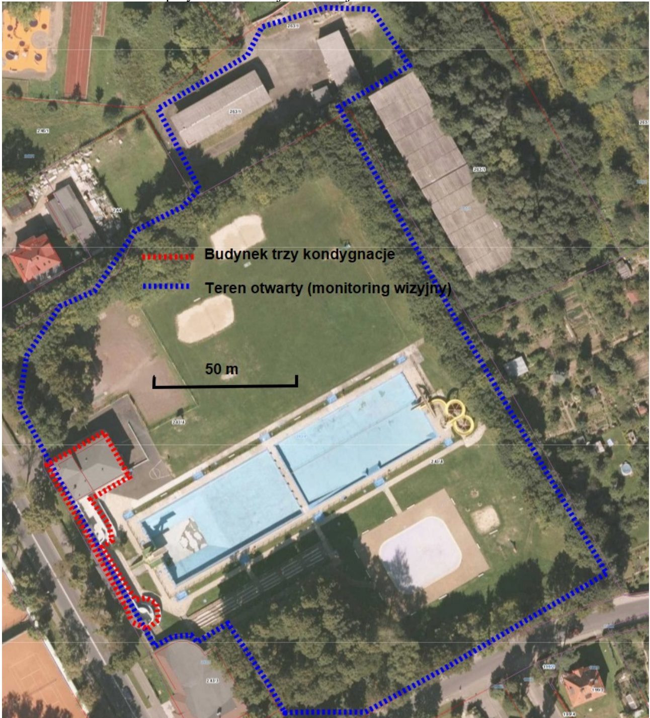
Rys. 2. Teren przeznaczony do monitoringu wizyjnego, oraz rozmieszczenie budynków przeznaczonych do montażu instalacji alarmowej.